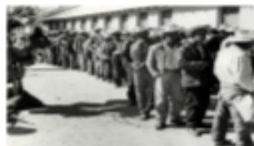
Trabajadores mexicanos hacen fila para poder optar por un empleo