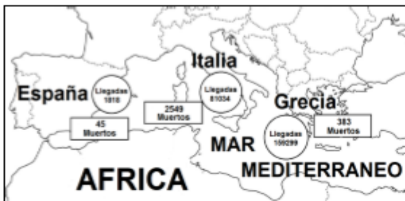
Casos de migraciones en el 2016

La imagen anterior muestra datos de migraciones africanas hacia Europa, una de las razones que explica esta situación es la