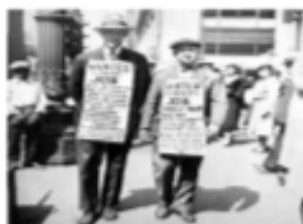
En busca de empleo en una ciudad norteamericana