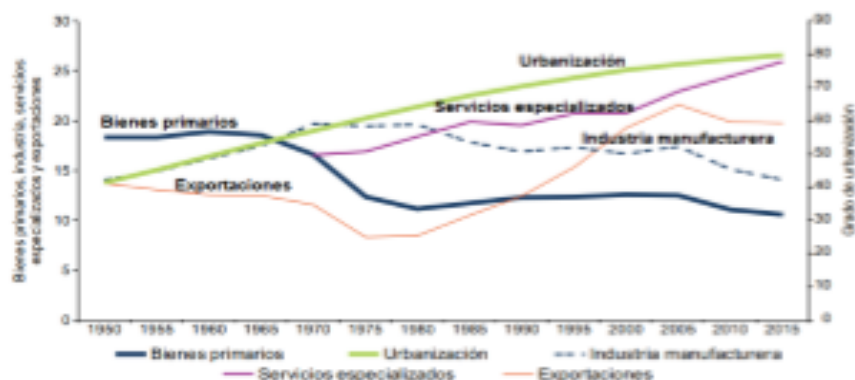
América Latina y el Caribe: estilos de desarrollo y urbanización, 1950-2015 (En porcentajes del PIB y porcentajes urbanos)

A partir de la información de la gráfica anterior, se puede afirmar que el proceso de globalización ha provocado en las economías latinoamericanas