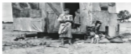
Refugio en una zona rural de los Estados Unidos.