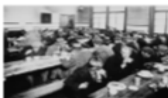
Comedor en Buenos Aires